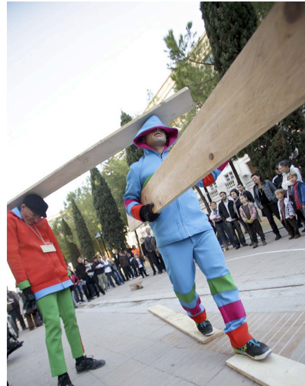
Performance en la calle