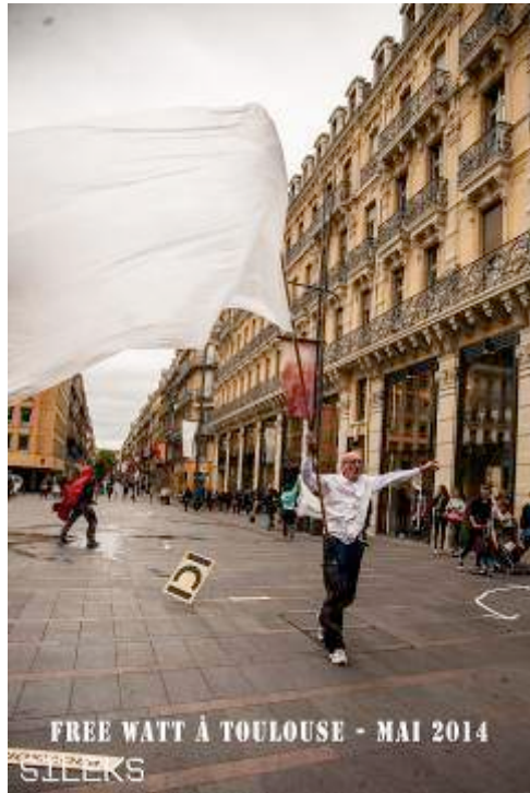
Toulouse, Saison d'ARTO

Cadre : désir de l'organisateur d'investir et de se réapproprié une rue commerçante très passante en plein centre de Toulouse