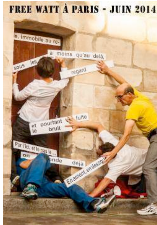
Paris 20ème, Festival Et20'Eté

Forme : plusieurs interventions quotidiennes d'environ 40 minutes