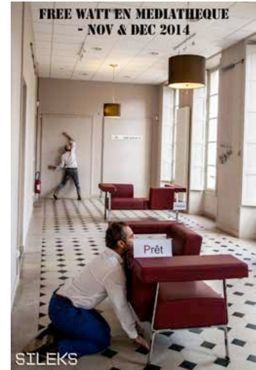
Médiathèque de Morsang-sur-Orge (91) et de Lunel (30)

Cadre : intervenir à l'intérieur d'une médiathèque lors des horaires normales d'ouvertures.