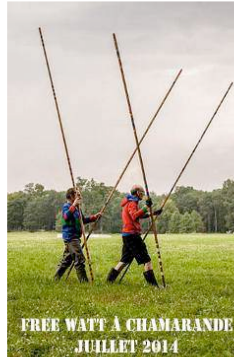
Domaine Départemental de Chamarande

Forme : création d'un spectacle-parcours, performance déambulatoire d'environ 45 minutes